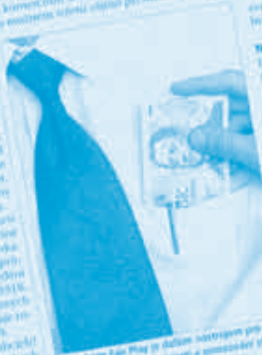
Databáze Fair Play je dostupná veřejně pro zveřejnění transparentnosti a umožnění přehledu o veřejné správě.

Veřejnost bude mít díky databázi pohled na příjmy a jiné údaje o vztazích politiků s firmami, jinými subjekty, a také lepší přehled o ostatních aktivitách politiků při rozhodování ve veřejném zájmu.